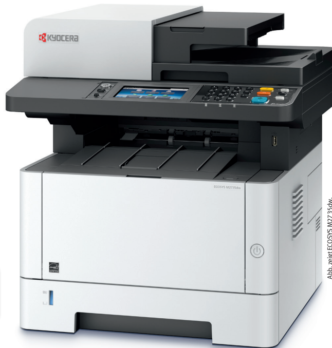
Abb. zeigt ECOSYS M2735dw.